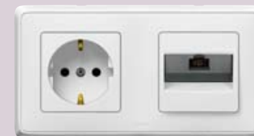
Розетка 2K+3 и розетка RJ45