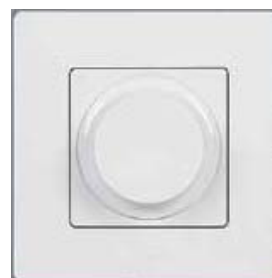
Поворотный универсальный светорегулятор