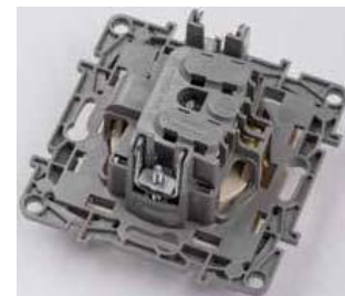
Обновленный механизм розетки 2К+3 ЕТИКА