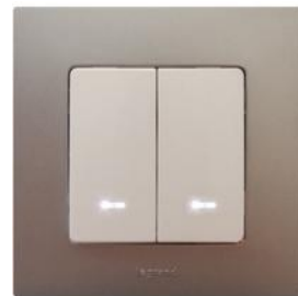
Двухклавишный выключатель с подсветкой/индикацией ЕТИКА