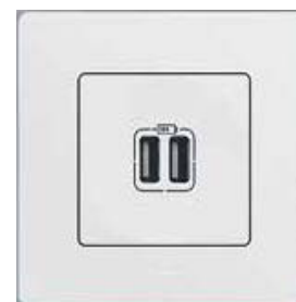
Зарядное устройство с двумя USB разъемами