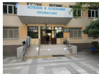
На фото: Ресурсный центр Сочинского профессионального техникума

Сочинский профессиональный техникум осуществляет подготовку квалифицированных специалистов в различных отраслях деятельности для крупнейших предприятий Краснодарского края. В техникуме ведётся проектная и учебно-исследовательская деятельность педагогов и обучающихся. В апреле 2013 г. при поддержке министерства образования Краснодарского края на базе техникума был открыт Ресурсный центр по энергетике, осуществляющий, в том числе подготовку специалистов по специальностям электротехнического профиля. Более подробная информация на сайте: http://www.pl19.ru